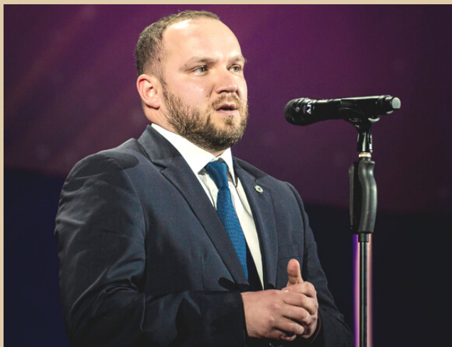
VADIMS LAŠENKO, LFF prezidents